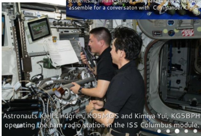
Astronauts Kjell Lindgren, KO5MOS and Kimiya Yui, KG5BPH operating the ham radio station in the ISS Columbus module.